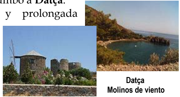
Datça Molinos de viento

Datça ubicada en la estrecha y prolongada península del mismo nombre, rodeada de pinos, fue en otro tiempo un pequeño pueblo, paraíso de mochileros; hoy la afluencia de embarcaciones de recreo la ha hecho crecer, pero aún resulta más tranquila que Mármaris o Bodrum.